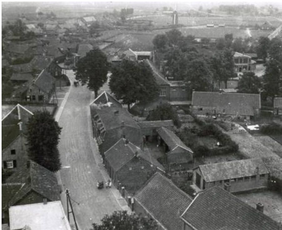
Rond 1935 zie je vanuit de Meijelse kerktoren en over de Schoolstraat Sanders'Molen nog staan in het Hagelkruisveld.