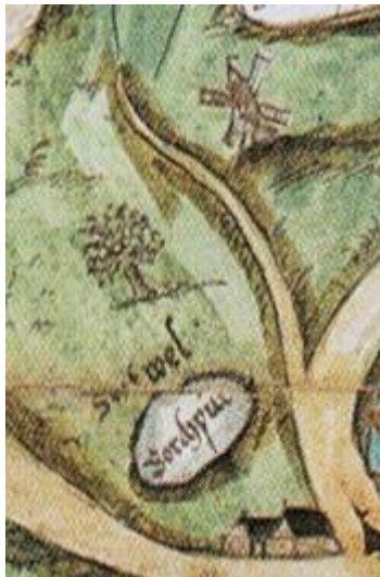
De banmolen van Meijel op een kaart getekend in 1591

Andere heren kregen maar het 32 ste deel, de Meijelse heren het 16 de deel, geen ruim 3% maar ruim 6% van het koren dat aangeleverd werd om gemalen te worden.