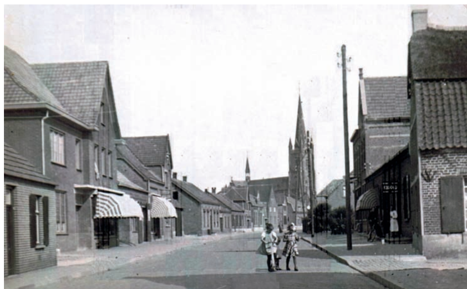
De Dorpsstraat ca. 1938.