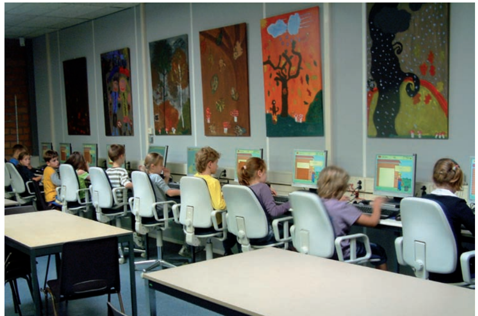
Uit de Brede School (tafeltjes leren met computer).