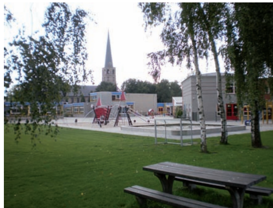
De Brede School in Meijel met kinderopvang.