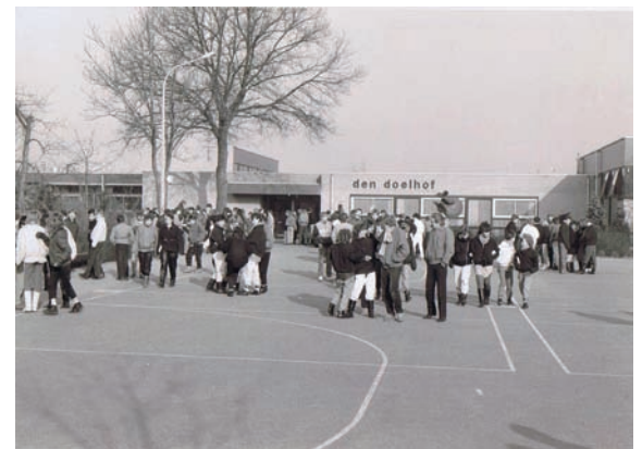
SG Den Doelhof Mavo-Lavo.