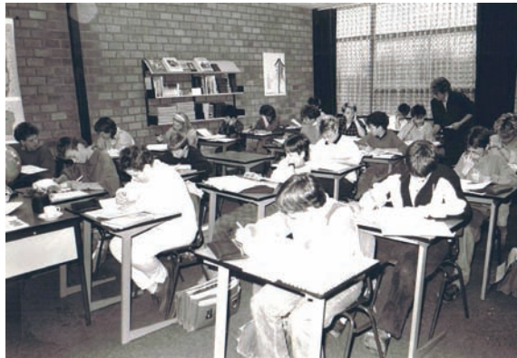
SG Den Doelhof Mavo-Lavo.