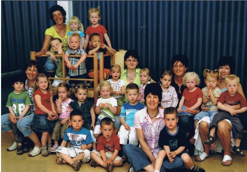
Peuterspeelzaal Ut Debberke in 2007.

versterkt door de eerste herinneringen aan seksuele voorlichting op school, niet verzorgd door zusters, maar door meesters. Binnen de school werd de voorbereiding op de eerste heilige communie als een gewoon onderdeel beschouwd, bedoeld voor alle leerlingen. Een klasgenootje dat daaraan niet deelnam werd door de anderen 'raar' gevonden. Niet alleen de kerk, ook andere instellingen werkten nog via de school. Wie zou het vandaag nog gewoon vinden, dat iemand van de bank wekelijks een 'kwartje' kwam ophalen om op het spaarbankboekje te zetten? Maar toen waren woorden als ADHD, dyslexie, rugzakkinderen of sleutelkinderen nog ongebruikte begrippen en werd er in de gymzaal gesport in uniformpjes of extra les gegeven in het kamertje van zuster Gratia.