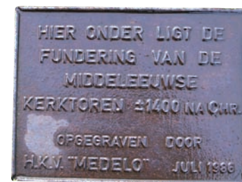
Deze plaquette werd in 1986 aangebracht in de bestrating na het terugvinden van de fundamente van de middeleeuwse toren.

Het is onwaarschijnlijk dat die kapel op de plek van de huidige kerk heeft gelegen. Eerder moet worden gedacht aan een locatie in de buurt van de Molenstraat-Hof omdat daar in die periode de bestuurlijke instellingen (schepensbank, banmolen, tiendschuur) van Meijel waren gevestigd en