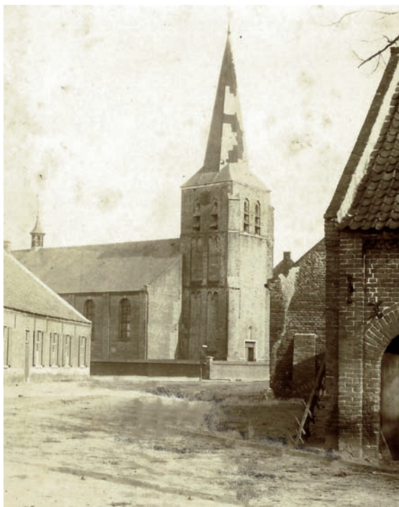
Blik op de middeleeuwse toren met links erachter het schip in waterstaatsstijl (foto ca. 1900).

Terugblikkend op de eeuwenoude geschiedenis van het dorp, is de 'kathedraal van de Peel' waarschijnlijk het gebouw waarop de Meijelsen al die tijd het meest trots zijn geweest. Van de generatie die de kerk van buiten en binnen heeft aanschouwd, zijn er niet zo veel meer onder ons, maar zij herinneren zich de bijzondere allure, rijkdom en afmetingen van dit godshuis. De schok was dan ook groot toen de kerk op 25 september 1944 door de terugtrekkende Duitsers met dynamiet werd opgeblazen. In het hoofdstuk over de oorlog kan daarover meer worden gelezen. In deze bijdrage is de paragraaf over de 'kathedraal' het centrale thema. Voorafgaand wordt er aandacht besteed aan vroegere godshuizen in Meijel. Daarna worden de belangrijkste achtergronden van de huidige kerk van Meijel, toch ook een gebouw van bijzondere allure, gepresenteerd. Aan de noodkerken en schuilkerk uit de Franse Tijd wordt hier geen aandacht besteed. Daarvoor leze men Meer dan turf van Henk Willems.