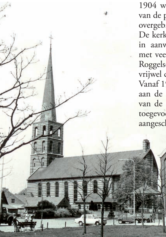
De huidige kerk van Meijel op een foto uit de jaren 1970.

Door alle oorlogsbeslommeringen en het gebrek aan materialen en financiën, duurde het na de verwoesting meer dan 10 jaar voordat Meijel weer een volwaardige kerk had. Vlak na de oorlog ging men ter kerke in zalen, vanaf 1946 in een nieuw gebouwde noodkerk (nu beugelbaan).