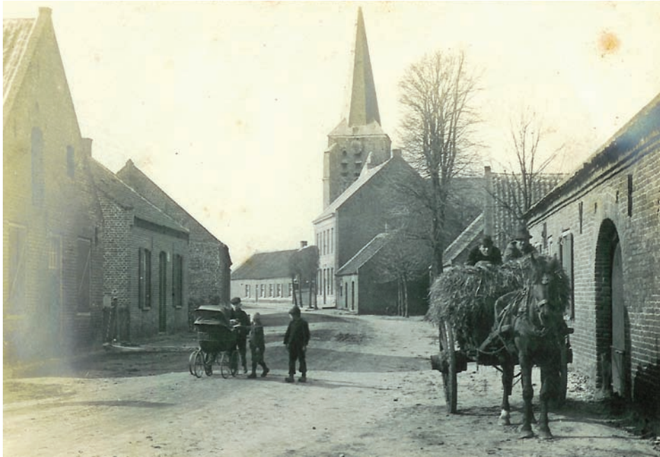
Een fraaie blik vanaf de zuidkant op de kerk. We zien de situatie omstreeks 1900.

waarschijnlijk ook de meeste dorpingen woonden.