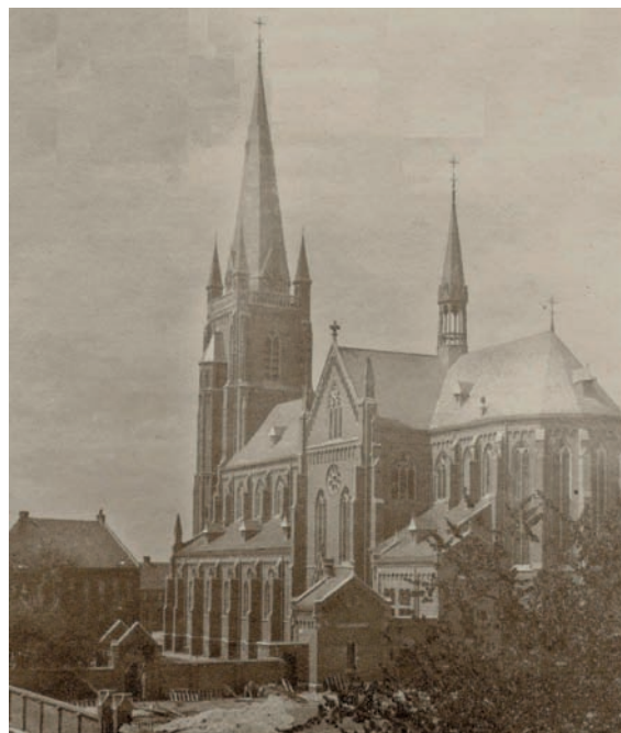
De 'kathedraal van de Peel' vanaf het zuiden gezien.

In 1901 keurde de bisschop de nieuwbouw goed. Het ging om een bouwbedrag van ongeveer 100.000 gulden, inclusief de noodkerk die nog eerst moest worden opgetrokken omdat het nieuwe