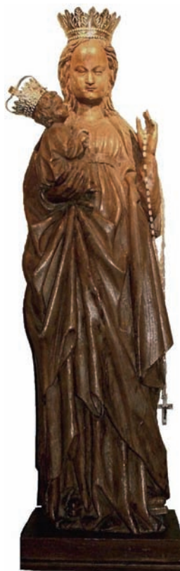
Het fraaie Mariabeeld (ca. 1500) in de Mariakapel achterin de huidige kerk. Het stond eeuwen in de Mariakapel op het einde van de Dorpsstraat.