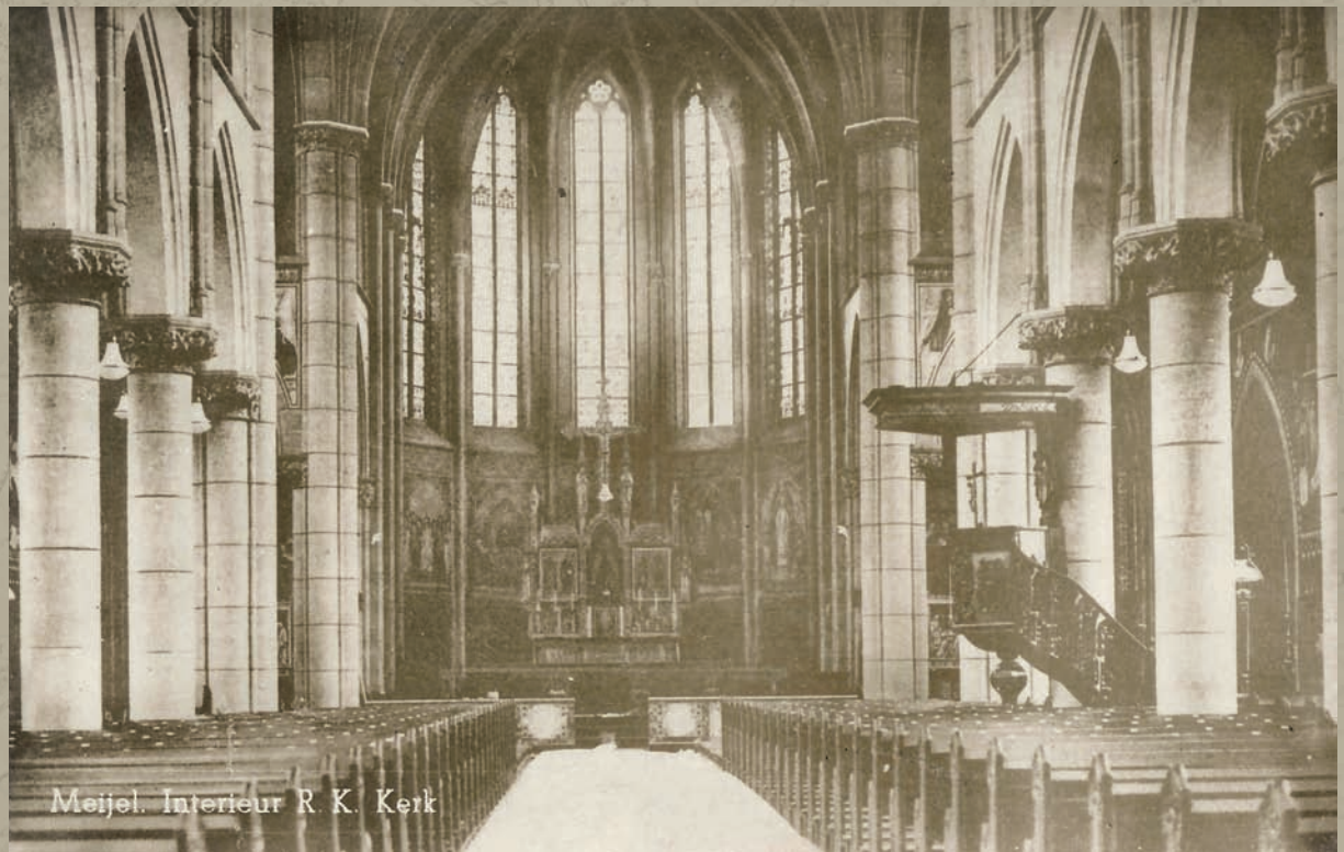
Meijel. Interieur R. K. Kerk

Het rijke interieur van de 'kathedraal van de Peel'.