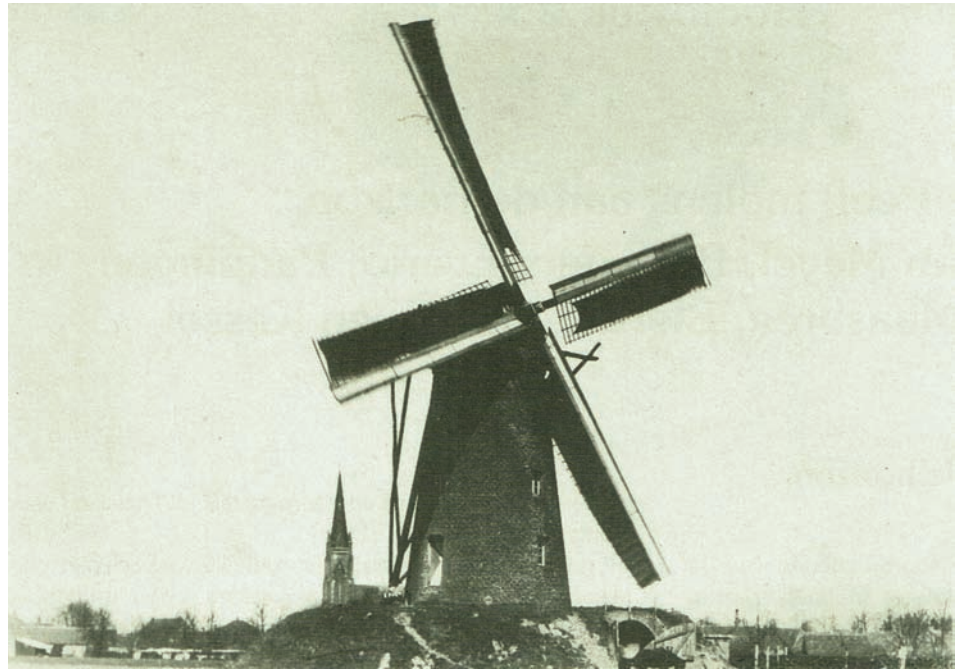
De molen van Sanders uit 1872 in het Hagelkruisveld, ca. 1925.

Op 13 april 1872 meldde de krant De Volksvriend uit Roermond: 'Sedert eenigen is de gemeente Meijel getuige geweest van baldadigheden van allerlei aard, gepleegd door brooddronken jonge lieden uit het dorp, en bestaande gewoonlijk in het slaan op deuren en vensters bij rustige ingezetenen, en zelfs wel het moedwillig inwerpen van ruiten, terwijl die straatschenderijen gewoonlijk onvervolgd moesten blijven bij gebrek aan voldoende aanwijzing der daders, want ruitbrekers en zoogenaamde muiskesvangers blijven gewoonlijk niet aan de deuren wachten tot men hen opent.'