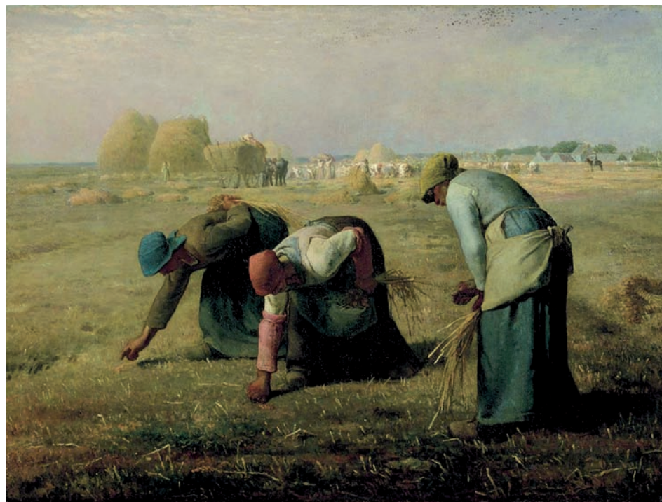
J.-F. Millet, De arenleesters, 1857, coll. Musée d'Orsay, Parijs.