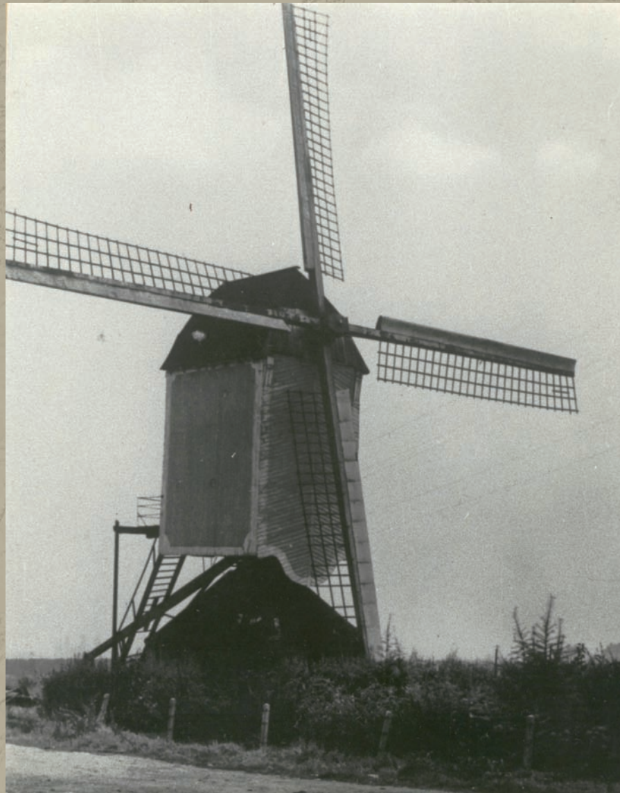
De oude Meijelse banmolen in Kessel.