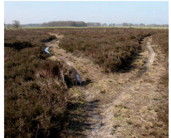
Zo zal het grootste deel van Meijel er rond 1840 hebben uitgezien.

De kaart van Pichot laat zien dat in 1843 ongeveer 75% van het Meijelse grondgebied uit woeste grond bestond, vooral veen en heidegebied. Hoger gelegen zandkoppen werden afgewisseld door moerassen en tientallen poelen. Voor moderne natuurliefhebbers moet het een waar Mekka zijn geweest, maar er is geen bewijs dat de ruige natuur op zichzelf voor de Meijelnaren van toen ook maar enige positieve gevoelswaarde had.