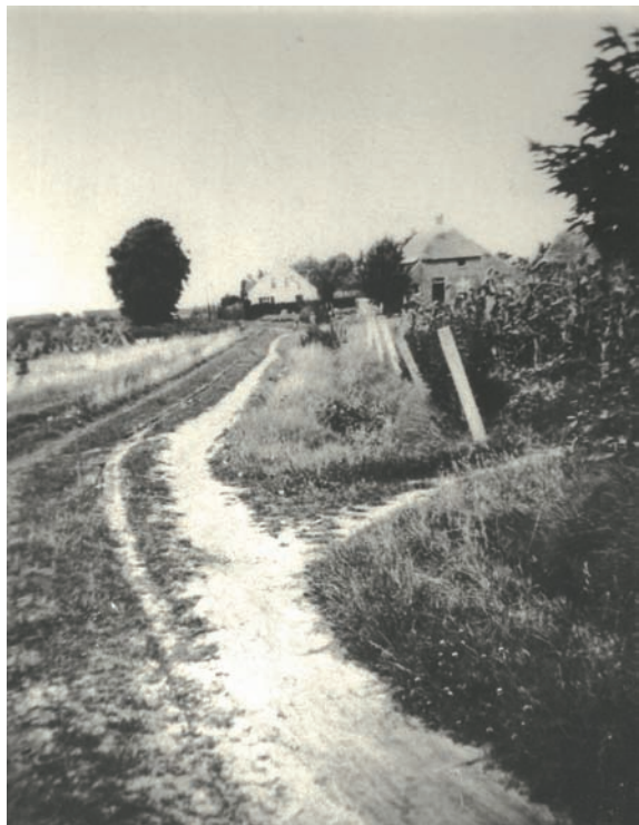
De Heuvel was vóór de oorlog een zanderig pad, zoals er voor 1900 zoveel waren in Meijel.

De provinciale inspecteur van de buurtwegen klaagde in zijn verslag uit 1860 over de situatie in Meijel: de wegen waren in Meijel veel te breed, zanderig en bovendien tolereerde het gemeentebestuur onterecht dat karren met smal spoor (uit Brabant) over de wegen voeren, wat veel schade toebrengt; Limburg kende immers karren met breed spoor. Ook zou de gemeente moeten optreden tegen de gewoonte van veel Meijelse huiseigenaren om hun turfschoppen op de openbare weg te bouwen. Tenslotte riep de provincie het bestuur op om per omgaande over te gaan tot het nauwkeurig afbakenen van de wegen. Het onderhoud