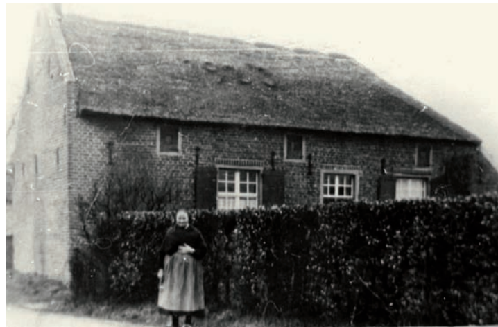
De eeuwenoude boerderij van de familie Van de Kraan brandde in de oorlog af. Twee kinderen kwamen daarbij om het leven.

Met name aan de zuid-west en zuid-oost lagen lagere gronden als een krans van strakke, elk door houtwallen omringde graslanden; vaak waren dit ontginningen (ook wel 'kamp' geheten: Steenkamp , Kampsteeg , Eckelkamp ). Die houtwallen staan op