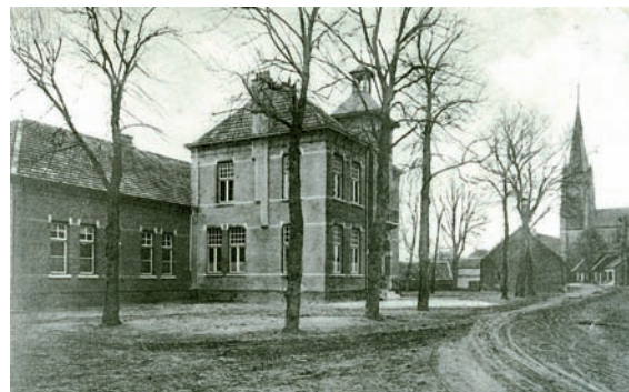
Raadhuis in voorbouw en school uit 1914 daarachter.