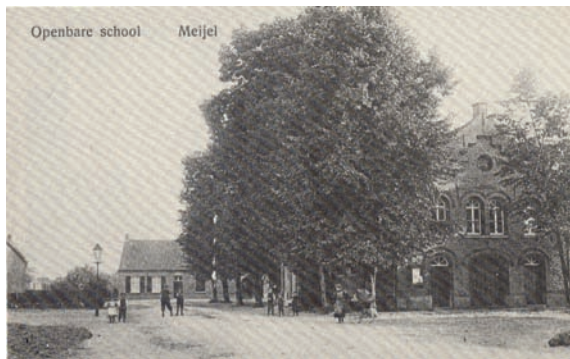
Het raadhuis uit 1865 met aan de zuidzijde er achter de school, nog juist zichtbaar onder de bomen.