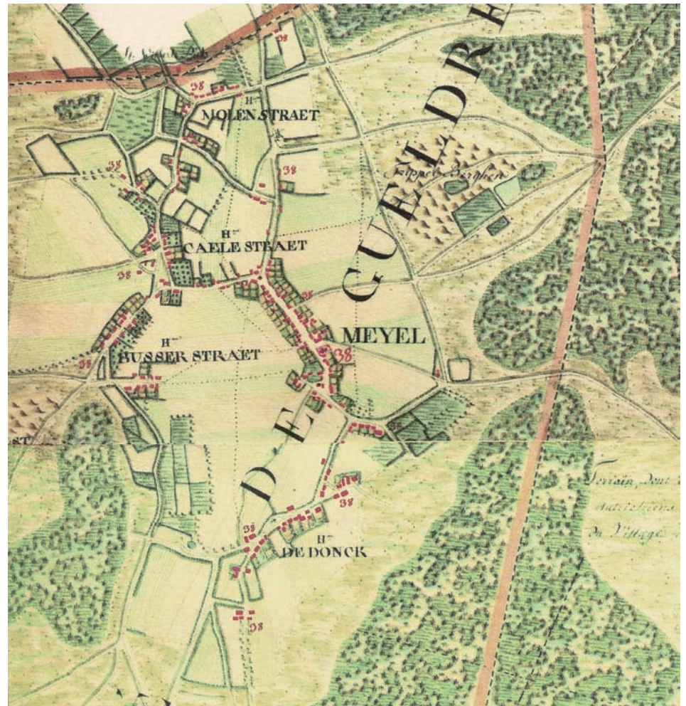
Ferrariskaart, ca. 1777.