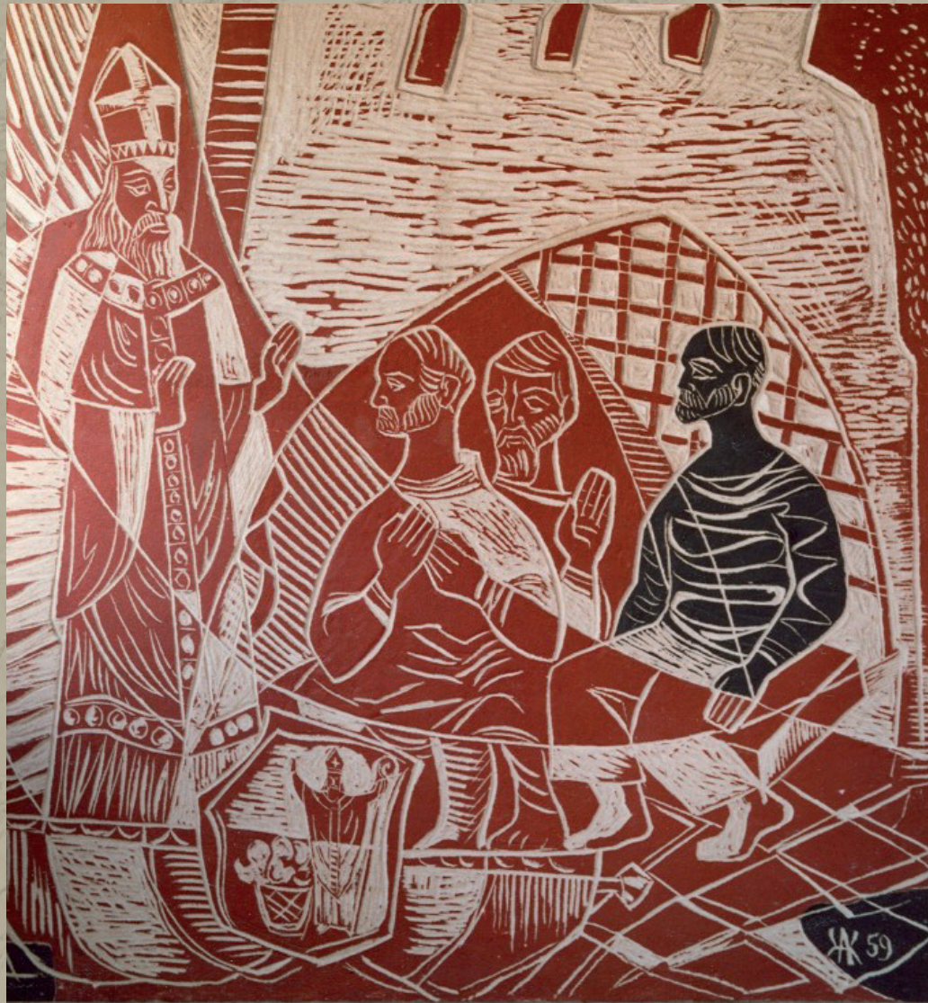
St. Nicolaasreliëf door Kasimir Knotke (sgraffito, 1959).