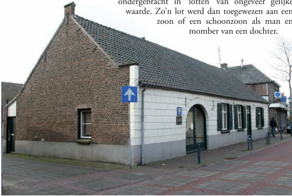
'Pand Veltmans' uit 1757 in de Meijelse Dorpsstraat.

ondergebracht in 'lotten' van ongeveer gelijke waarde. Zo'n lot werd dan toegewezen aan een zoon of een schoonzoon als man en moeder van een dochter.