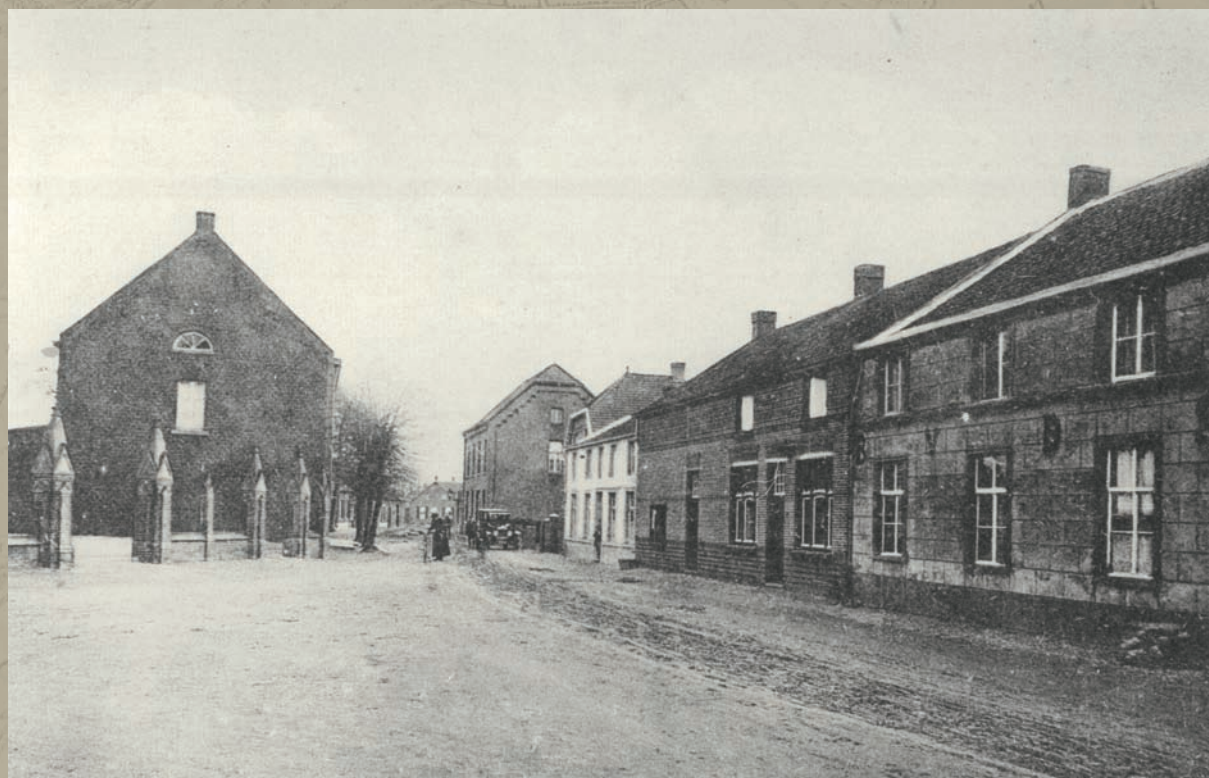
Kijk vanuit de Straat naar de Schoolstraat, rechts pand Goossens (BVDSAK) en daarnaast pand Van der Steen.