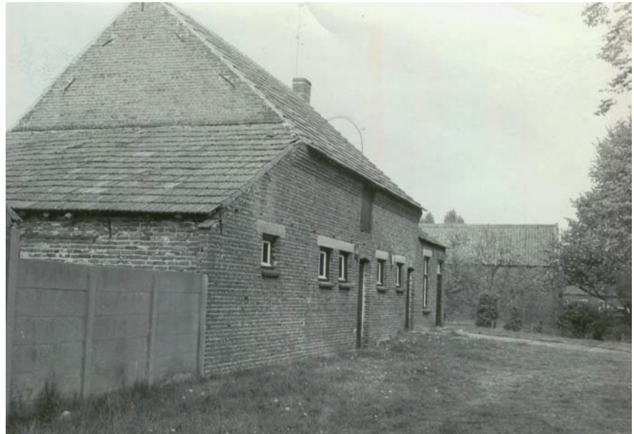
Resten van de oude herberg Den Swaen aan de Molenstraat.