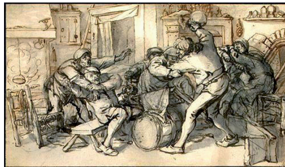
Vechtpartij in de kroeg (tekening 17 de eeuw).

De ligging aan de enige weg door het centrum van de Peel werd steeds meer een nadeel. Dat bleek ook in januari 1709. Er kwam een regiment ruiters, Spaanse of Staatse, door Meijel op weg naar het klooster Sint-Elisabethsdal in Nunhem. Daar zouden ze ingekwartierd worden, maar de prior van dat klooster zorgde ervoor dat ze niet verder dan Meijel kwamen en daar voor 100 ducaton verteerden.