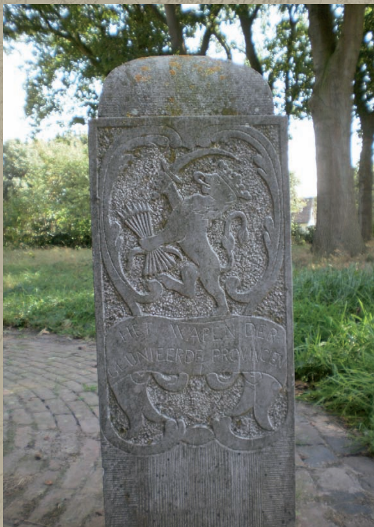
Grenssteen 1761 met het wapen van de Zeven Geunieerde Provinciën, de leeuw met zeven pijlen.