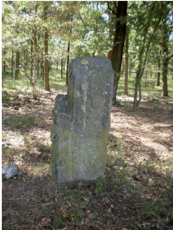
Grenssteen uit 1630 op Amsloberg.

De inwoners van Meijel en Nederweert hadden waarschijnlijk weinig problemen met elkaar. Ze hadden ieder hun veengronden om turf te steken en woeste gronden met hei om hun schapen te laten grazen en hun bijenkoprven te plaatsen. Soms pakten ze van elkaar een paar schapen of een kar turf, omdat ze meenden dat die 'gepand' mochten worden. Panden of arresteren was het in beslag nemen van dieren of goederen die zich volgens de beslaglegger ten onrechte op zijn gebied bevonden. Dan werden de grenspunten Grote