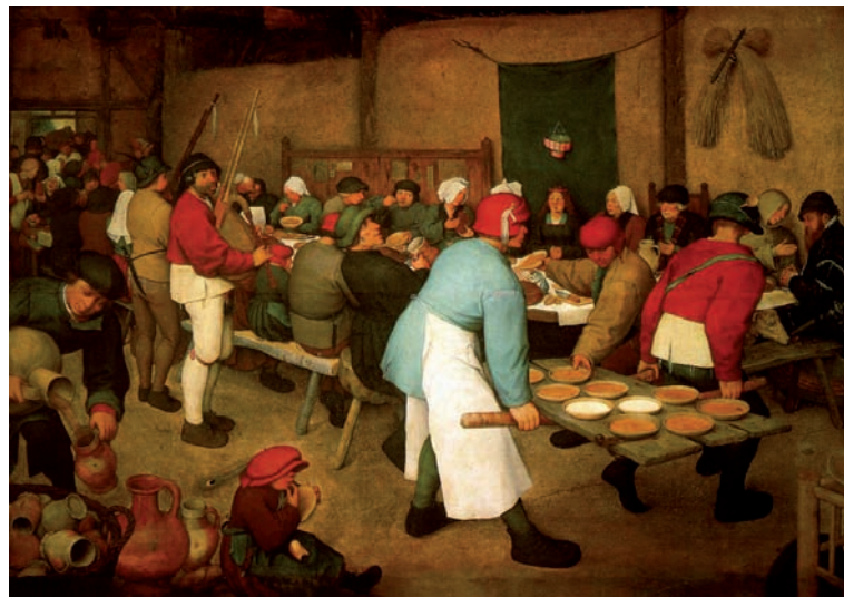
Pieter Breughel de O., De boerenbruiloft, ca. 1568 (coll. Kunsthistorisches Museum, Wenen).