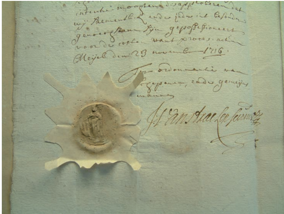
Zegel van de Meijelse schepenbank. 1716.

Ze zouden hun taak naar eer en geweten vervullen en ze verklaarden dat ze niemand enige toezegging gedaan hadden om de functie te krijgen.