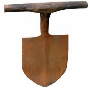
Turfgereedschap, z.g. lijnizer.