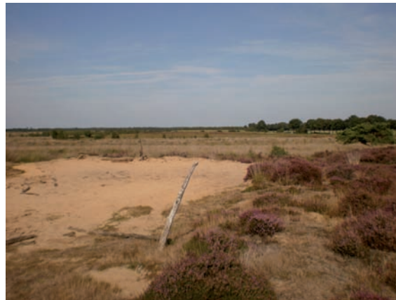
De Peel bij Amsloberg.

Er waren geen ambtenaren in dienst van de schepenen. Allerlei praktisch werk als uitzetten van turfvelen, opsporen van overtredingen of controle op wegen en hand- en spandiensten werd gedaan door gemeensmannen, inwoners die dit naast hun gewone werk tegen een zeer geringe vergoeding deden. Officieel werden de schepenen volgens de in 1483 op schrift gestelde rechten door de heer van Meijel aangesteld. In praktijk werden ze in Meijel aangewezen en legden ze de eed af in handen van de schout als vertegenwoordiger van de heer.