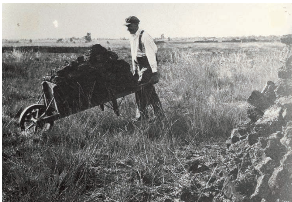
Naar de hoop.