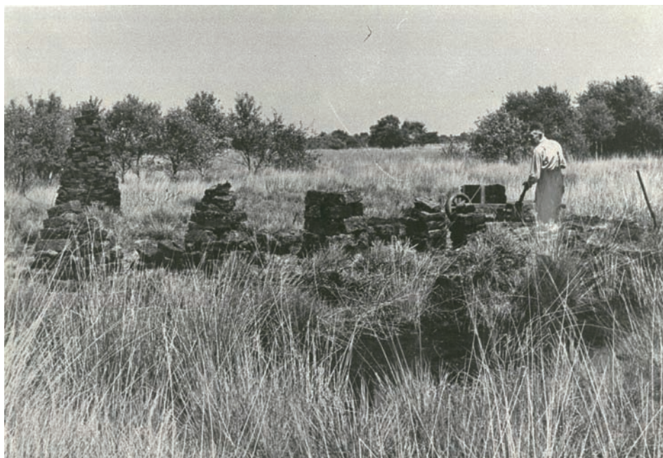
Turfsteker Van Bussel..