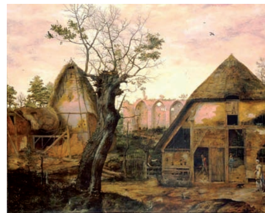
Cornelis van Dalem, Landschap met boerderij, 1564, coll. Alte Pinakothek, München.