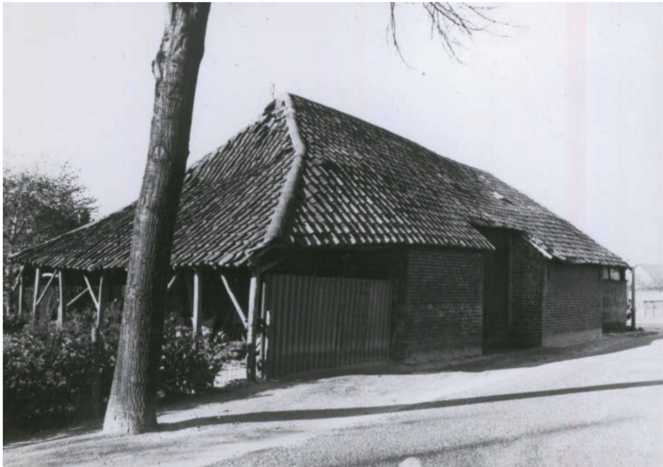
De eeuwenoude schuur van de Armenhof op de Heihorst. De schuur werd afgebroken in 1993 en stond model voor e.c. Truijenhof.