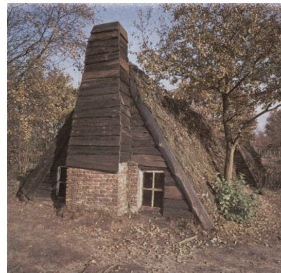
Soortgelijke plaggenhutten hebben zeker ook in Meijel gestaan.

De banmolen stond waar nu de hoek Kruisstraat - Molenbaan is. Die molen was in 1500 gepacht door Lemmen den Mollener, die er hulp had van Ghevert de zoon van de vorige pachter Thonijns den Mollener. Die molen werd telkens voor vier jaar verpacht voor 31 malder koren per jaar. De pachttermijn begon op 1 oktober en de 31 malder koren moest in twee termijnen geleverd worden op kasteel Ghoor te Neer. De Meijelse landbouwers mochten nergens anders hun koren laten malen, vandaar de naam 'banmolen'. Dat was niet zo moeilijk te controleren, want als de korenschoven op het land stonden reed een tiendheffer of gemeensman met een kar rond en pakte overal de elfde schoof voor de heer voor opslag in de tiendschuur. De Meijelsen hoefden dus niet het tiende deel van koren te leveren, maar het elfde deel. Het werd toch de korentiend genoemd. Pas daarna mochten de schoven naar de boerderij worden gebracht voor het dorsen. In 1463 hadden de heren van Meijel Johan en Willem van Ghoor zich verplicht ten behoeve van de Meijelsen de molen te onderhouden, in ruil voor maalloon. De banmolen waaide op 9 november 1800 omver en werd herbouwd in het Hagelkruisveld nabij de doorgaande weg.