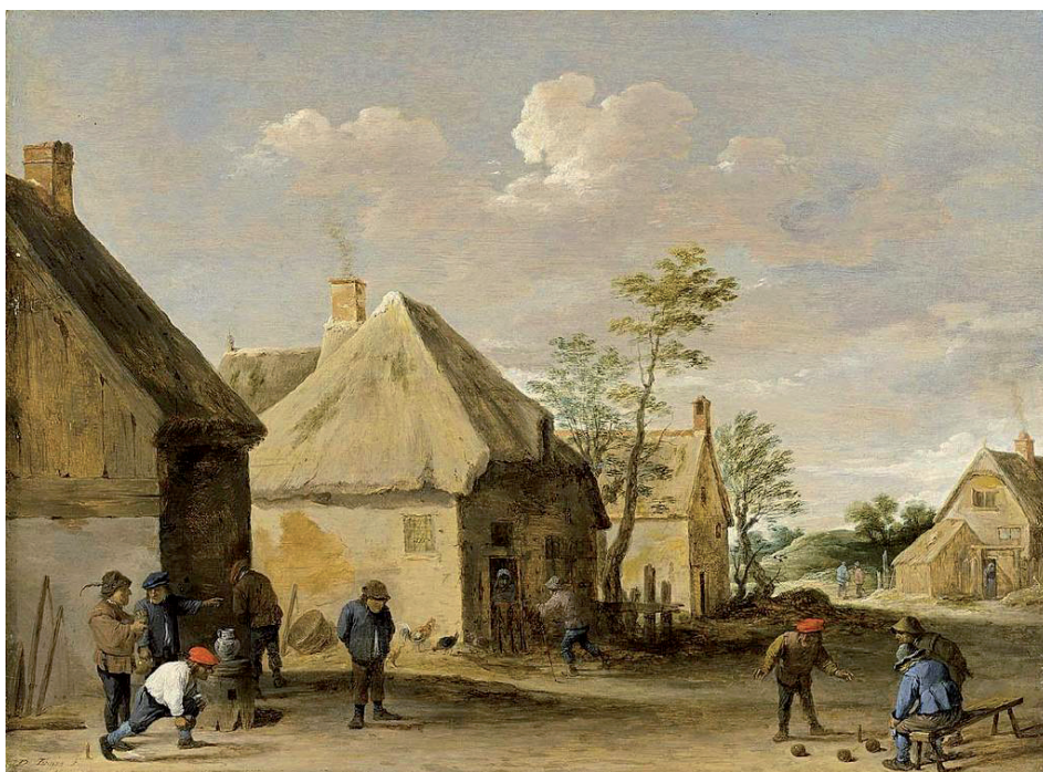
David Teniers de J., Dorpstafereel, ca. 1670.