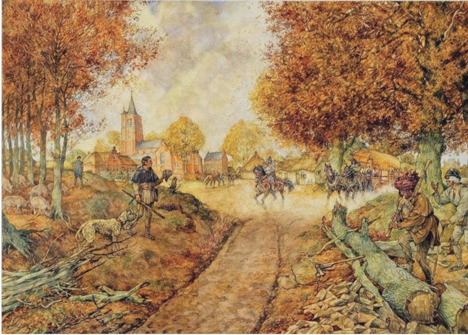
Brabants dorp omstreeks 1500 (schoolplaat Isings uit 1939).

Meijel, maar ook in Buggenum, op de Melenborg (Haelen) en elders. En als de heer turf nodig had, moesten ze hem die bezorgen op kasteel Ghoor te Neer.