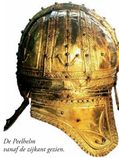
De Peelhelm vanaf de zijkant gezien.