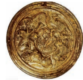
De sierschijf van Helden (coll. Rijksmuseum van Oudheden, Leiden).