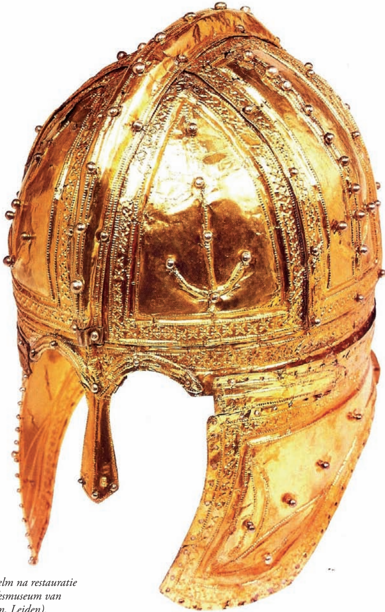
De Peelhelm na restauratie (coll. Rijksmuseum van Oudheden, Leiden).

De helm van Helenaveen is een Laat-Romeinse officiershelm. Enkel de papierdunne, verguld zilveren sierkap is bewaard gebleven. Deze was met klinknageltjes bevestigd op een ijzeren binnenkap waarvan in 1910 slechts minimale restanten werden aangetroffen. Onder die ijzeren kap zat oorspronkelijk nog een lederen binnenkap, gevuld met paardenhaar voor het draagcomfort. In Europa zijn ongeveer 10 van dergelijke pronkhelmen bekend. Waarschijnlijk werden ze gebruikt bij parades en ceremoniële gebeurtenissen. Ze kenmerken zich door een opbouw uit twee helften die aan de bovenzijde door een helmkam bij elkaar worden gehouden. Verder door twee wangbeschermers, een beweegbare nekbeschermer en een losse neusbeschermer. Verondersteld wordt dat dit type helm onder Sassanidische invloed is ontstaan en werd ingevoerd tijdens het bewind van keizer Constantijn I. Waarschijnlijk is de helm van Helenaveen vervaardigd in de keizerlijke werkplaats van Constantinopel.