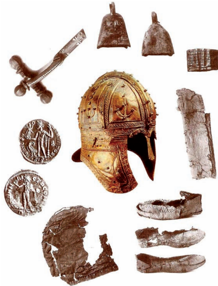
Overzicht van de vondst: helm, munten, fibula, paardeklokjes, dolkschede, schoenen en helmbuidel.

Het verhaal rond de Peelhelm begint op 17 juni 1910, toen de astmatische turfsteker Gebbel Smolenaars uit Meijel bij Helenaveen op een hard object stootte. Even dacht hij dat het een oude ketel was, maar het object had een fraaie schittering en ook lagen er munten en allerhande wapentuig bij. Gebbel nam de spullen mee naar zijn huis aan de Molenstraat, waar het object - dat vol met haar zat - door zijn vrouw Drika werd afgewassen en mooi gepoetst. Het bleek een fraai versierde, gouden helm te zijn. De spullen trokken volop bekijks; van heinde en verre trokken kijkers naar het boerderijtje van de vinder. Met de helm in een kistje achter op de fiets sjouwde de turfsteker in de zomer van 1910 de kermissen in de buurt af en liet er belangstellenden voor een dubbeltje naar kijken. Zijn buurjongen Har Hanssen ging mee. Na maanden soebatten over de eigendomsrechten verkocht Gebbel het kleinood een paar maanden later voor 1200 gulden aan het Rijksmuseum van Oudheden in Leiden.