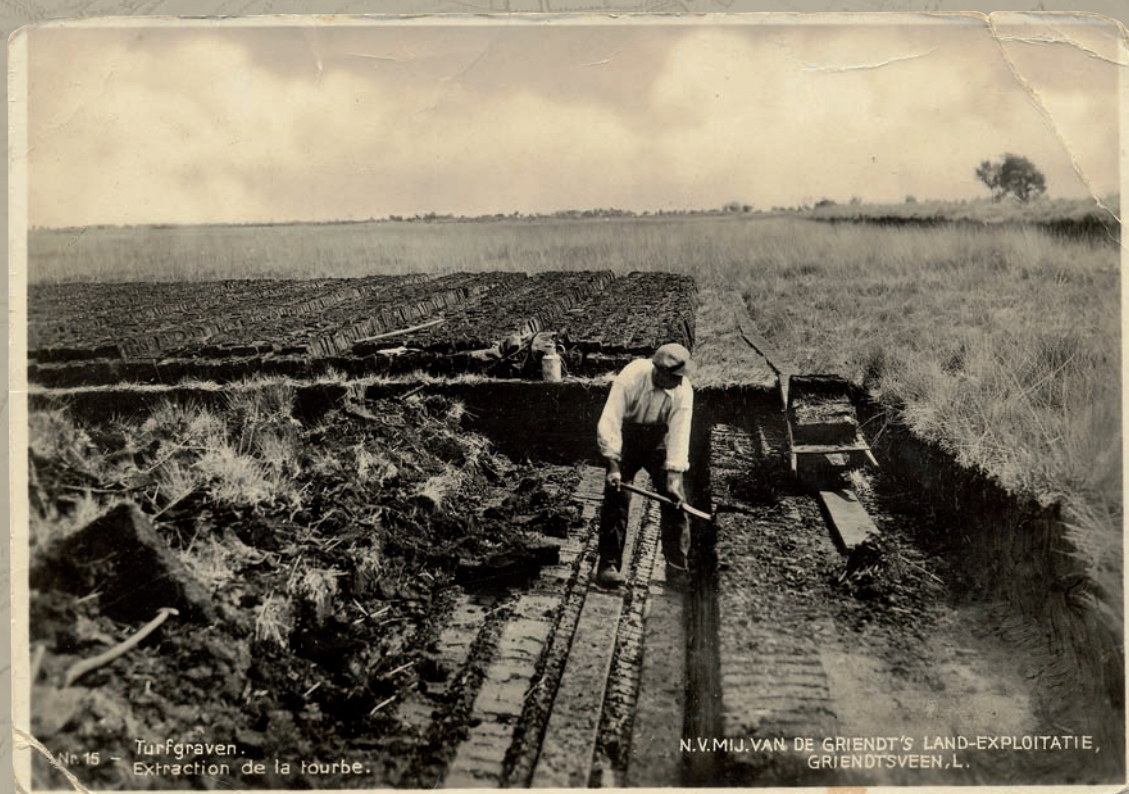
Nr 15 - Turfgraven. Extraction de la tourbe.