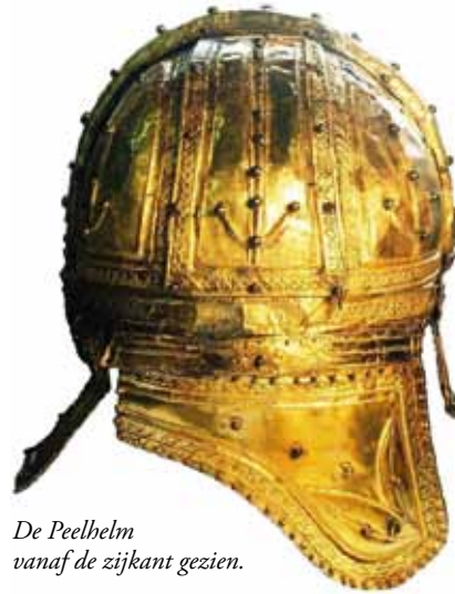
De Peelhelm vanaf de zijkant gezien.