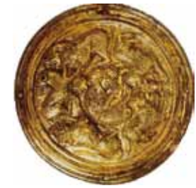
De sierschijf van Helden (coll. Rijksmuseum van Oudheden)