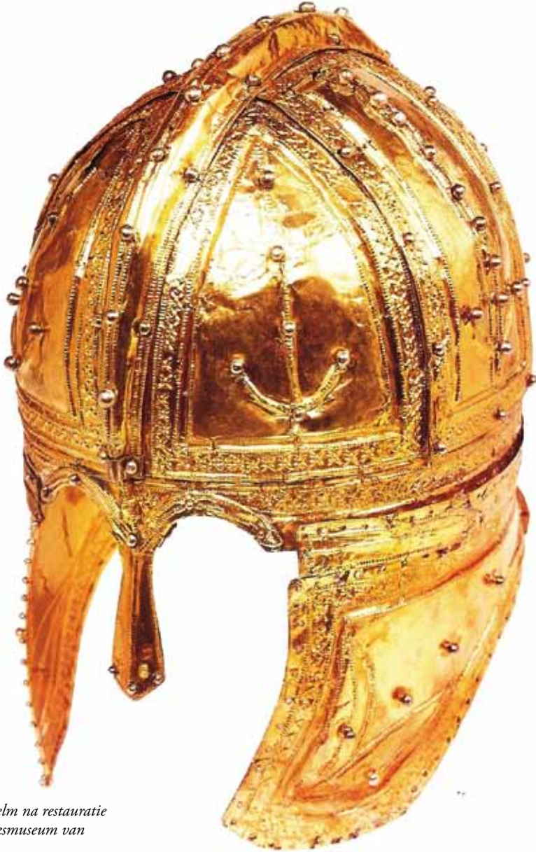
De Peelhelm na restauratie (coll. Rijksmuseum van Oudheid.

De helm van Helenaveen is een Laat-Romeinse officiershelm. Enkel de papierdunne, verguld zilveren sierkap is bewaard gebleven. Deze was met klinknageltjes bevestigd op een ijzeren binnenkap waarvan in 1910 slechts minimale restanten werden aangetroffen. Onder die ijzeren kap zat oorspronkelijk nog een lederen binnenkap, gevuld met paardenhaar voor het draagcomfort. In Europa zijn ongeveer 10 van dergelijke pronkhelmen bekend. Waarschijnlijk werden ze gebruikt bij parades en ceremoniële gebeurtenissen. Ze kenmerken zich door een opbouw uit twee helften die aan de bovenzijde door een helmkam bij elkaar worden gehouden. Verder door twee wangbeschermers, een beweegbare nekbeschermer en een losse neusbeschermer. Verondersteld wordt dat dit type helm onder Sassanidische invloed is ontstaan en werd ingevoerd tijdens het bewind van keizer Constantijn I. Waarschijnlijk is de helm van Helenaveen vervaardigd in de keizerlijke werkplaats van Constantinopel.