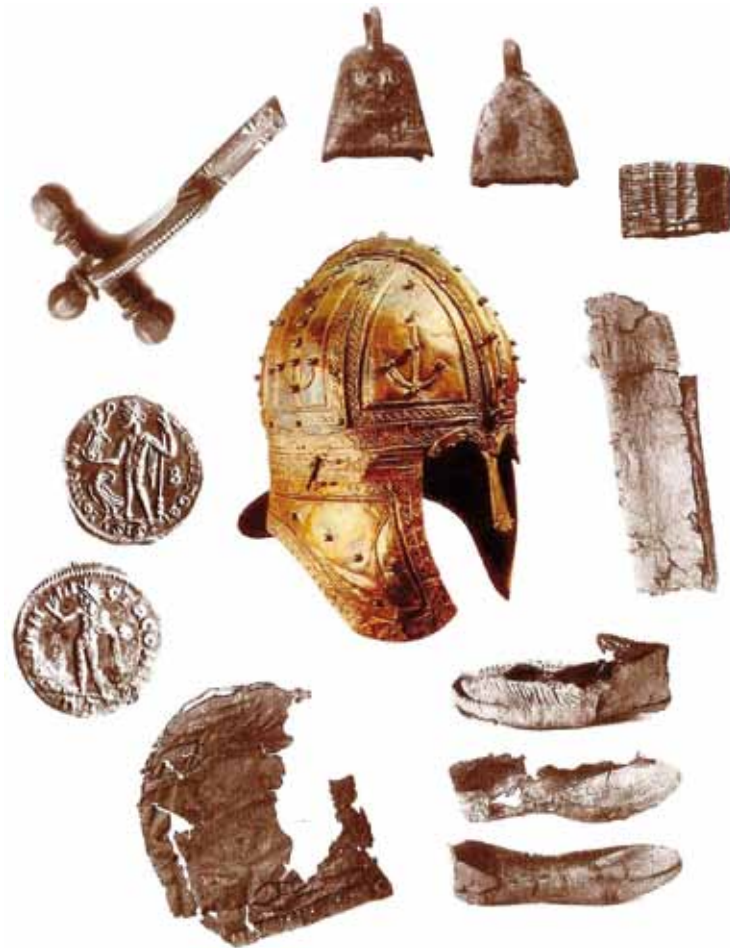
Overzicht van de vondst helm, munten, fibula, paardeklok.