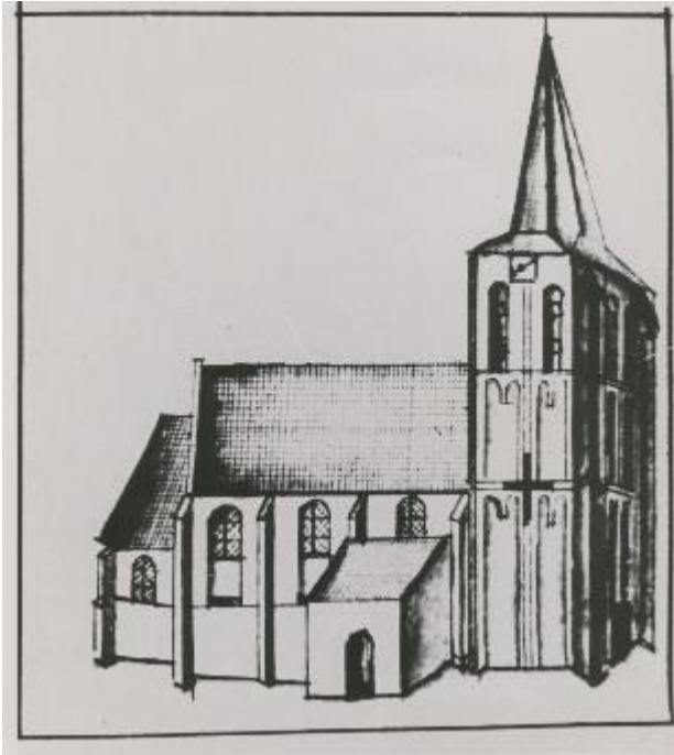
De kerk van Meijel uit 1425