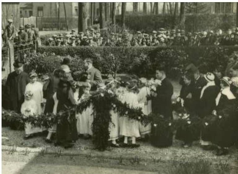
Op weg naar de eerste heilige mis in Meijel